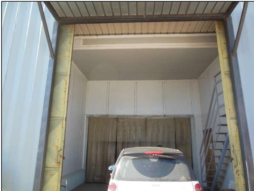
Figura 8: Ingresso principale capannone – Sub. 7