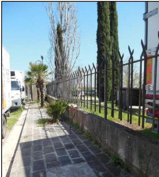
Figura 25: Dettaglio recinzione del compendio