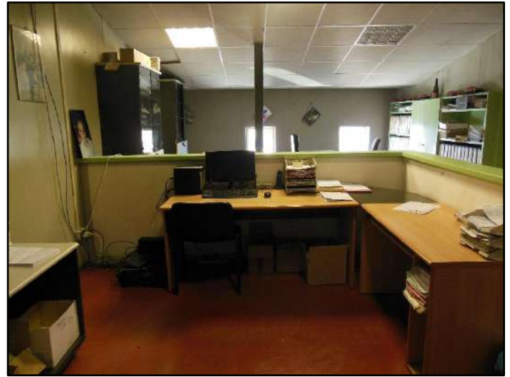
Figura 18: Zona uffici e amministrazione Piano primo - Sub.7