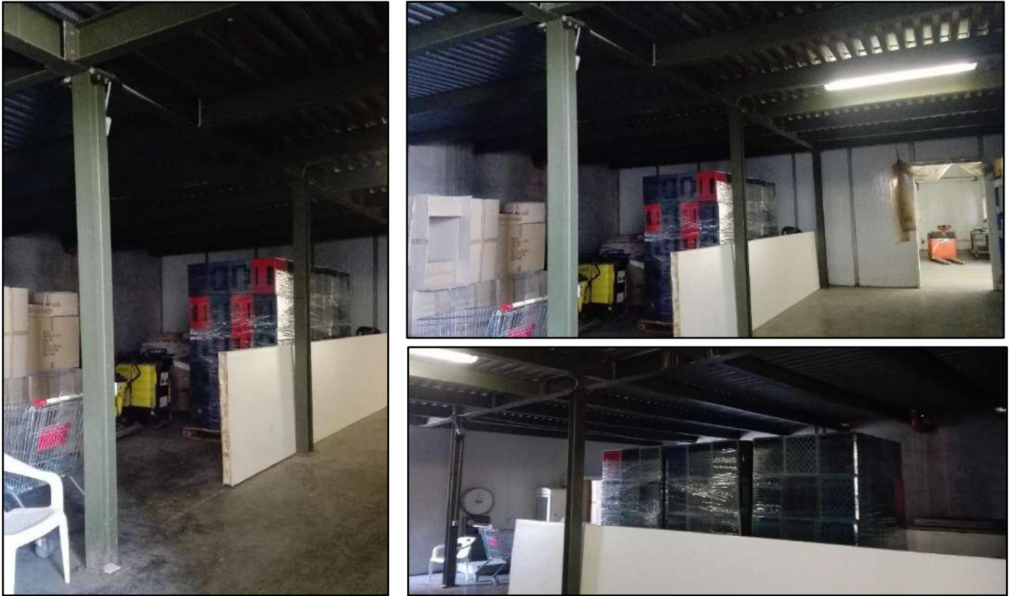
Figura 14: Ambiente deposito Piano terra - Sub.7