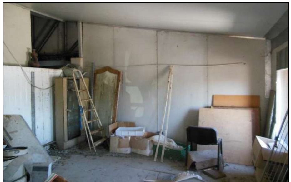
Figura 20: Vano tecnico Piano primo - Sub.7