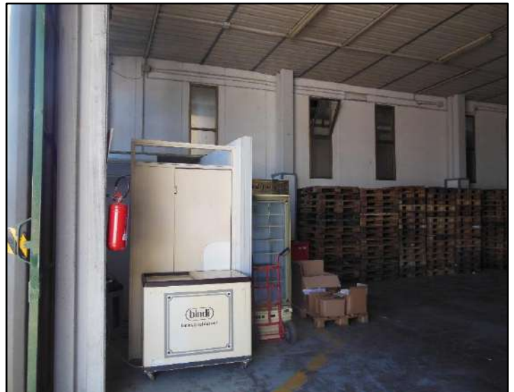
Figura 2: Bagno di servizio ricavato in zona prospiciente l'ingresso - Sub.6