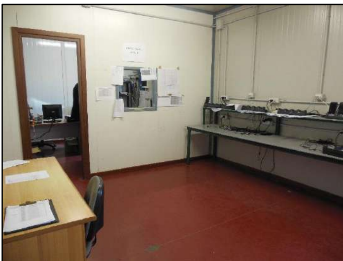
Figura 15: Zona uffici Piano terra - Sub.7