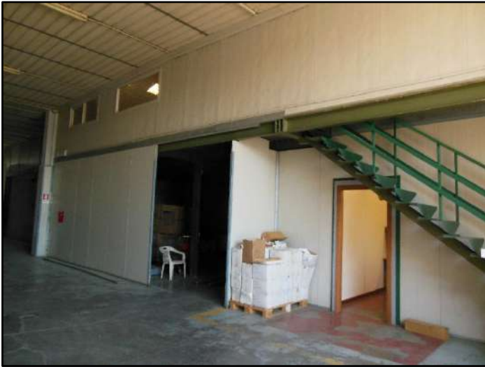
Figura 4: Scala di accesso alla zona uffici-amministrazione al Piano 1