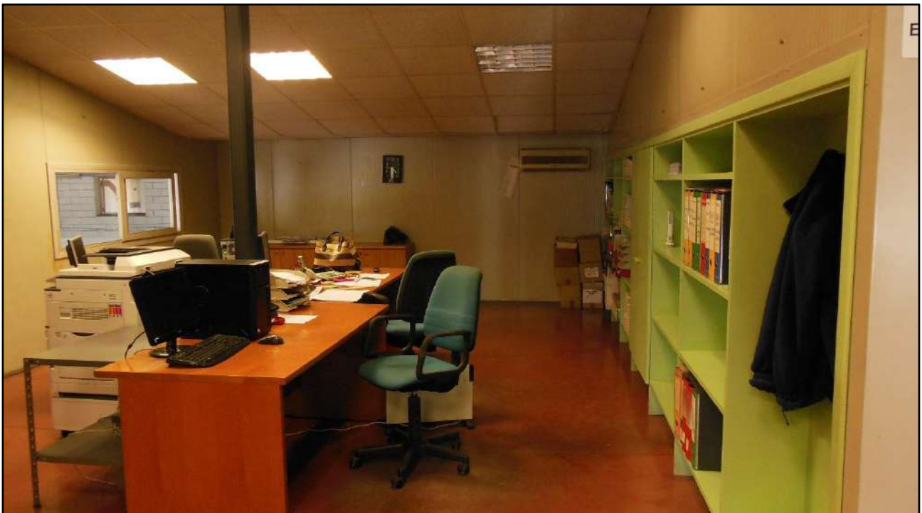
Figura 17: Zona uffici e amministrazione Piano primo - Sub.7