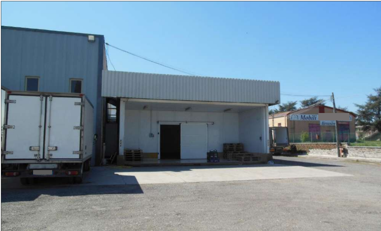
Figura 21: Viste esterne capannone e piazzale antistante