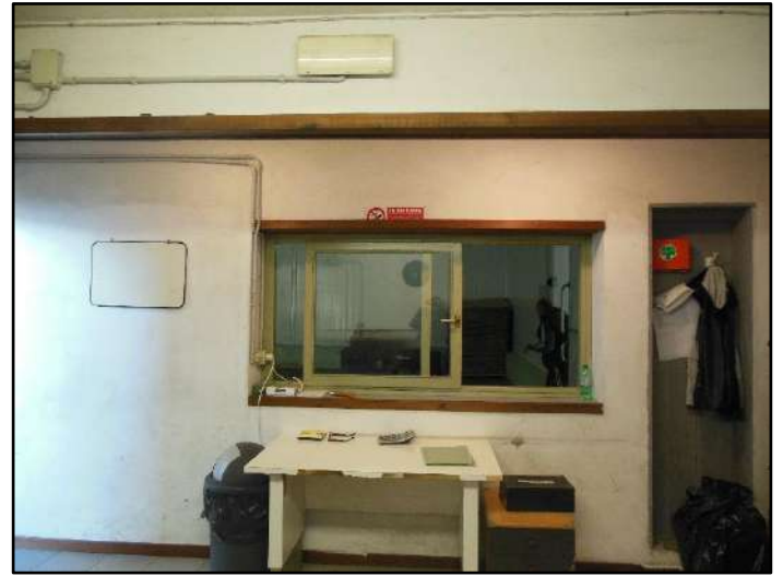
Figura 9: Ambiente destinato ad uffici al Piano T – Sub. 7 Figura 10: Ambiente destinato ad uffici al Piano T – Sub. 7