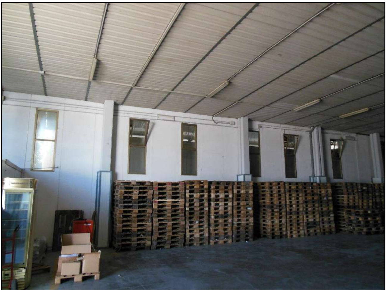
Figura 6: Distribuzione delle aperture sulla parete del magazzino