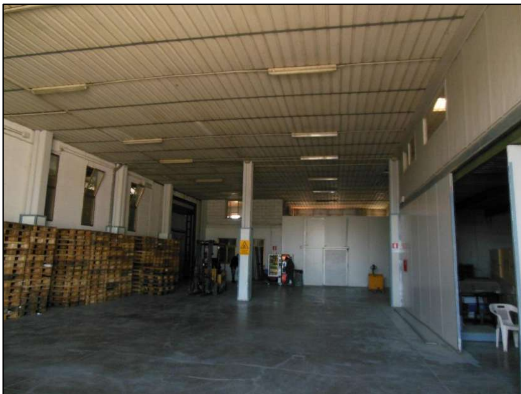
Figura 3: Ambiente destinato a magazzino - Sub. 6