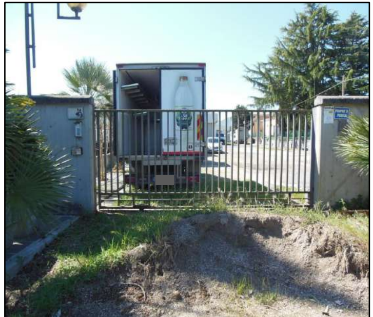
Figura 26: Dettaglio di uno dei cancelli di ingresso più vicini alla Strada Nepesina