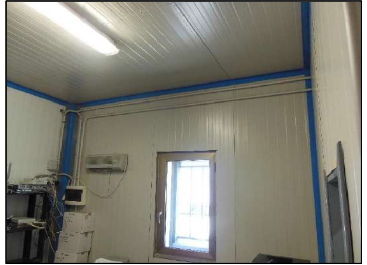
Figura 16: Zona uffici Piano terra - Sub.7