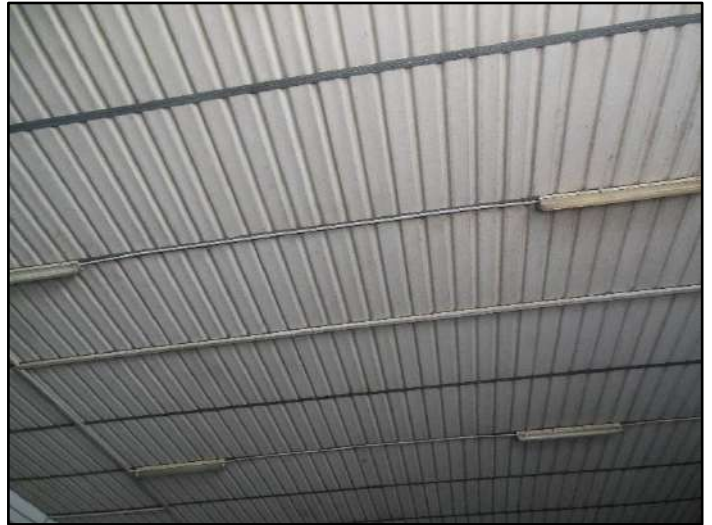
Figura 5: Dettaglio copertura magazzino – Sub. 6