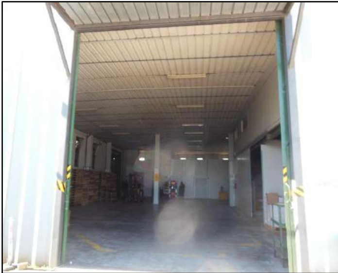
Figura 1: Ingresso principale capannone - Sub.6