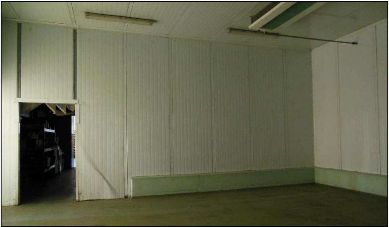
Figura 12: Ambiente magazzino Piano terra - Sub.7