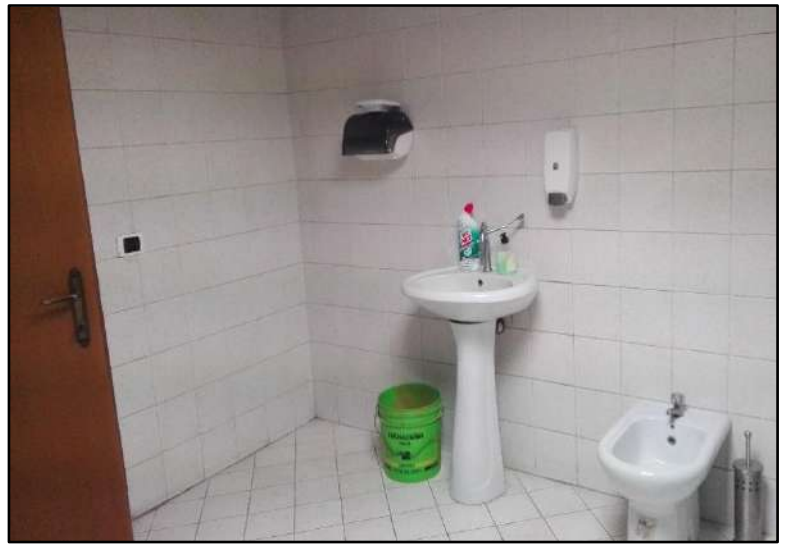
Figura 19: Bagno Piano primo - Sub.7