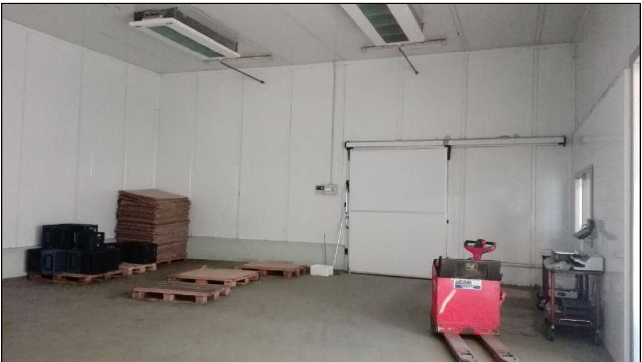
Figura 13: Ambiente magazzino Piano terra - Sub.7